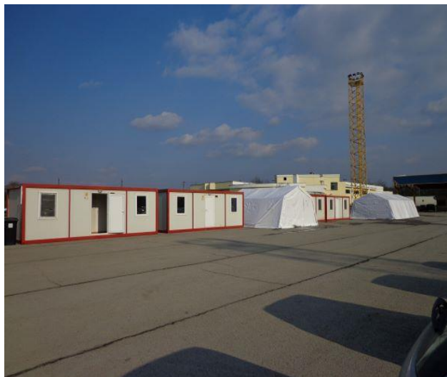
ГКПП „Дунав мост“ – Буферна зона триаж

Служители от ГД „Гранична полиция“ посочиха пред екипа на НПМ, че до настоящия момент все още не е имало случай на влизачи украински граждани, желаещи да получат временна закрила, като най-вероятна причина за това е, че идващите украински граждани се притесняват, че при влизане в Република България, регистрацията и предоставяне на временна закрила националните им паспорти ще бъдат иззети, няма да им бъдат върнати и няма да може да се завърнат в Украйна.