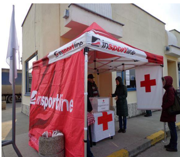
Пункт на БЧК