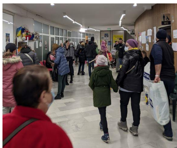
Център за съдействие на бежанци от Украйна – гр. Варна