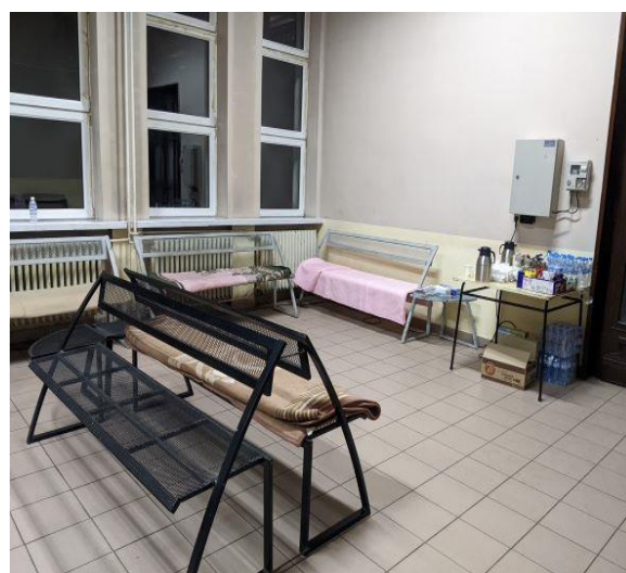
ЖП гара – Русе

Предвид това НПМ отправя препоръка към Министерски съвет да бъде проведена широка информационна кампания сред украинските граждани за реда за предоставяне на временна закрила и правата, които ще придобият в Република България, както и да бъде обявен телефонът на Националното бюро за правна помощ с цел предоставяне на адекватна юридическа помощ.