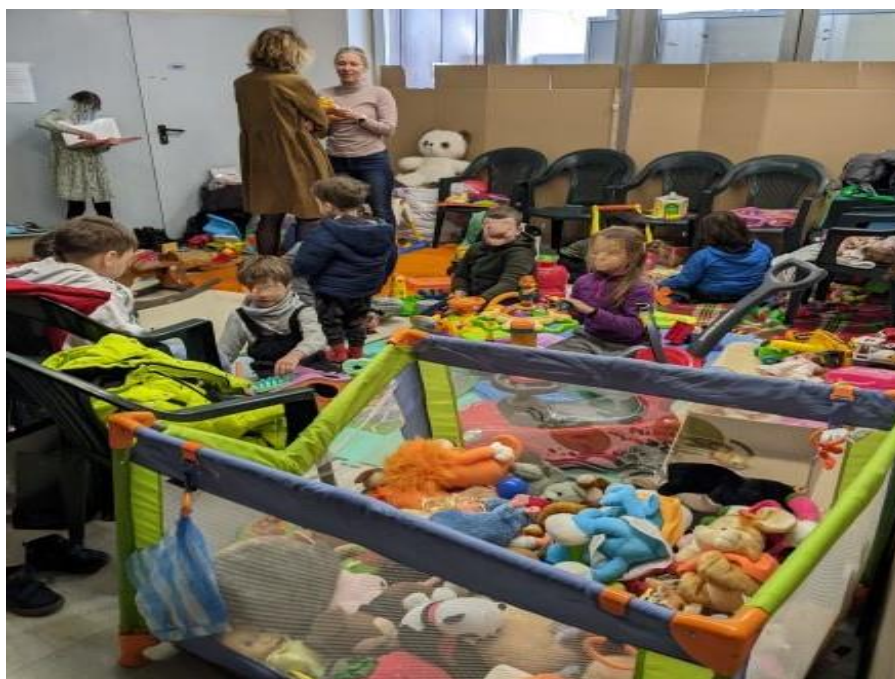
Детски кът в Центъра за съдействие на бежанци от Украйна – гр. Варна

Събраната информация е базирана на проведени срещи и интервюта с представители на отговорните администрации и украински граждани, потърсили закрила, проверка на място на изградените пунктове за прием на документи за предоставяне на временна закрила и хотелите, в които са настанени украинските граждани.